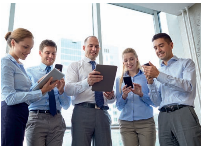
Wir leben heute in einer Welt der „gesenkten Häupter“. Jeder hat sein Smartphone ständig im Blick. Makler haben jetzt mit einer persönlichen App die Möglichkeit, wichtige Informationen über diesen Weg an Kunden gelangen zu lassen und so das Smartphone als Marketinginstrument zu nutzen.

Es lässt sich für VIP-Kunden innerhalb der App eine Gruppe einrichten, die man dann direkt anschreiben kann.